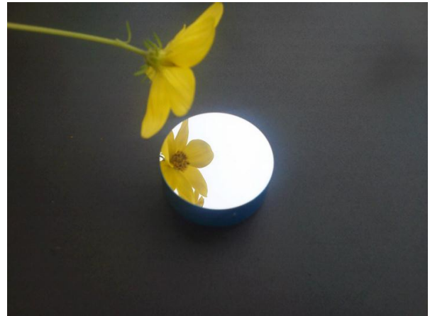
64チタンにφ0.5の穴をあけたサンプル アルミ合金を切削加工で鏡面仕上げにしたサンプル