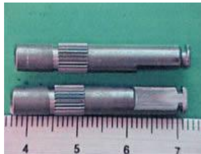
Dカットを圧造加工