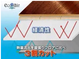
エコエアフロアリング